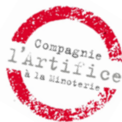
illustration : Quentin Van Gysel